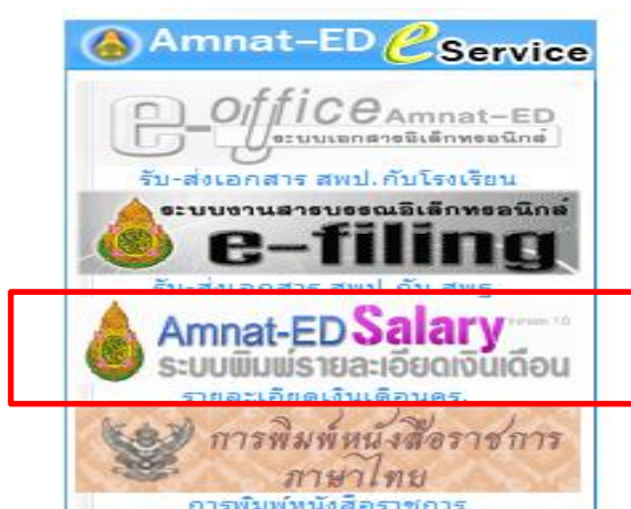
รูปที่ 1 หัวข้อ e-service