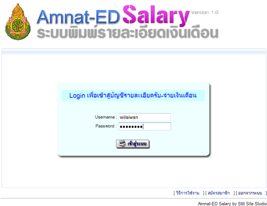
รูปที่ 5 Login เพื่อเข้าสู่บัญชีรายละเอียดยอดเงินเดือนรายบุคคล

เมื่อทำการสมัครสมาชิกเรียบร้อยแล้ว ให้กลับไปยังหน้าจอหลักของโปรแกรม ดังรูปที่ 2 จากนั้น ทำการกรอกข้อมูล username และ password แล้วคลิกปุ่มเข้าสู่ระบบ ดังรูปที่ 5